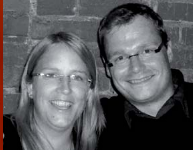
Illustration: Rolf Vogt ARVI