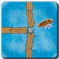
Steg J 4x