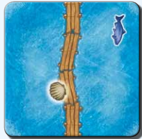
Steg F 1x