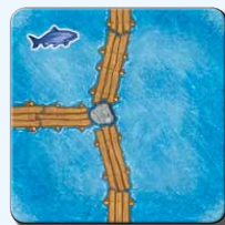
Steg M 1x