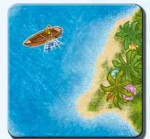
Insel IC 1x