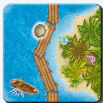
Insel IE 1x