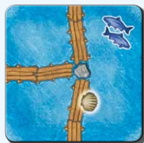
Steg L 1x