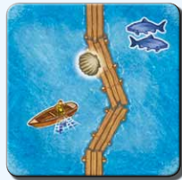
Steg B 1x