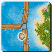
Insel II 1x