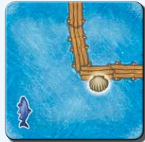
Steg G 2x