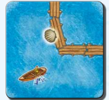
Steg I 2x