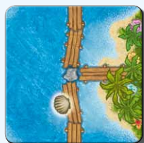
Insel IK 1x