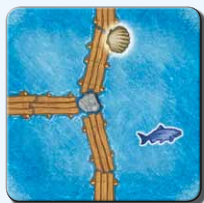
Steg K 1x