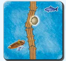
Steg D 1x