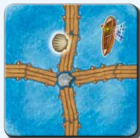
Steg P 1x