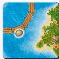
Insel IG 2x