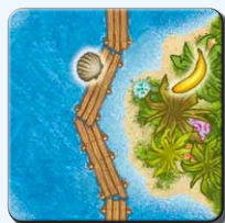
Insel IF 1x