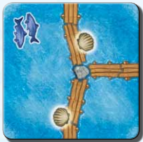
Steg O 1x