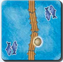
Steg E 1x