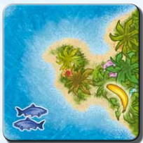
Insel ID 1x