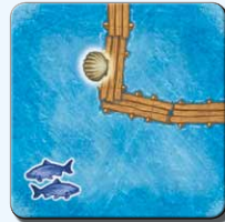
Steg H 1x