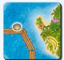
Insel IH 2x