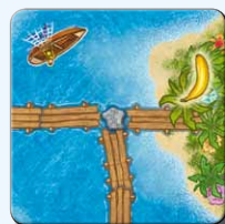
Insel IL 1x