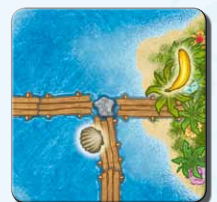
Insel IM 1x

Alle Karten, die mehrfach vorhanden sind, gibt es in grafisch unterschiedlichen Varianten (verschiedene Steg- oder Insel-Formen, etc.).