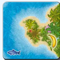
Insel IB 2x