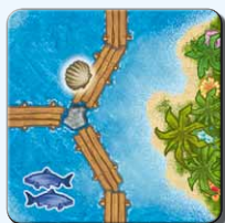
Insel IJ 2x