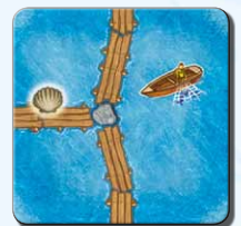
Steg N 1x