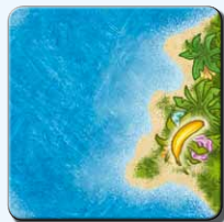
Insel IA 1x