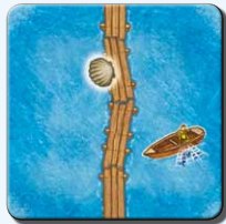
Steg A 3x