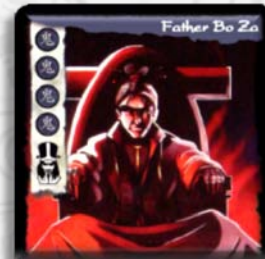
Neue Inkarnation: Father Bo Za