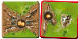
Ein Berg wird erweitert.