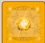
Rückseite normale Karte