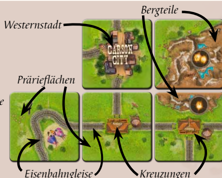
Die Symbole auf den Karten stehen für: