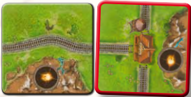
Eisenbahngleis und Prärie werden erweitert.