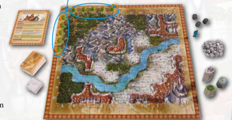
Spielaufbau für 2 Spieler

Jeder von euch stellt je einen Abenteurer in den Startbereich außerhalb der Zeilen 1, 2, 3, 4 und der Spalten A, B, C, D. Spielen nur zwei Spieler mit, stellen sie zusätzlich je einen Abenteurer in den Startbereich außerhalb von Reihe 5 und Spalte E.