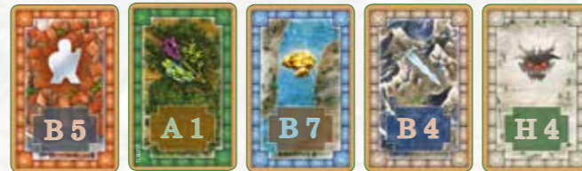
30 x Stadt 20 x Wald 18 x Fluss 28 x Gebirge 14 x Nebel