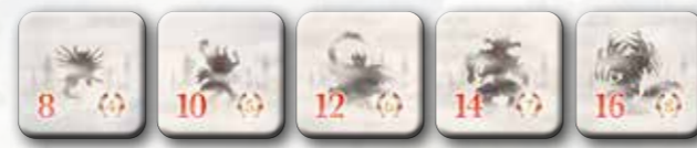
4 x 8 4 x 10 3 x 12 2 x 14 1 x 16