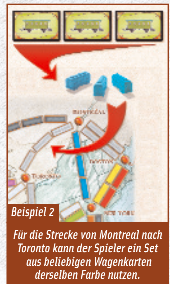
Für die Strecke von Montreal nach Toronto kann der Spieler ein Set aus beliebigen Wagenkarten derselben Farbe nutzen.