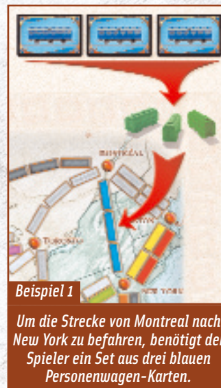
Um die Strecke von Montreal nach New York zu befahren, benötigt der Spieler ein Set aus drei blauen Personenwagen-Karten.

Wichtiger Hinweis: Beim Spiel zu zweit oder zu dritt kann nur eine der beiden Doppelstrecken genutzt werden. Wenn ein Spieler eine der Doppelstrecken in Anspruch genommen hat, ist die andere nicht mehr verfügbar.