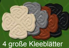
4 große Kleeblätter